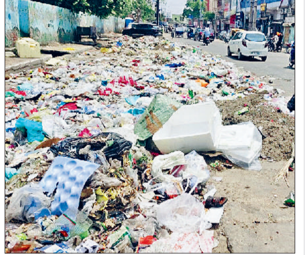
झज्जर। शहर के बीकानेर चौक पर सड़क किनारे दूर तक फैला कूड़ा।

कूड़ा उठान कार्य में लगे कर्मचारियों को जब वेतन नहीं मिला तो वे हड़ताल पर चले गए। कर्मचारियों के हड़ताल पर जाने के चलते शहर के डंपिंग प्लांटों पर कूड़े के अंبار लगने शुरू हो गए हैं। जिसके कारण आमजन को काफी परेशानियों का सामना करना पड़ रहा है। शहर के बीकानेर चौक, अंबेडकर चौक, दिल्ली गेट, पुराना बस स्टैंड आदि स्थानों पर कूड़े के ढेर लगे हैं। सड़क किनारे लगे इस कूड़े के ढेर में जहां पशु खाने की तलाश में मुंह मारते रहते हैं जिस कारण कूड़ा सड़क किनारे दूर तक फैल गया है।