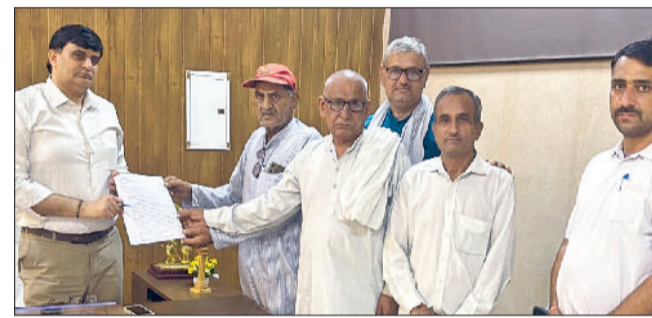
बहादुरगढ़। एसडीएम को ज्ञापन सौंपते किसान संगठनों के सदस्य।

बता दें कि पावरग्रिड कॉरपोरेशन द्वारा 5 राज्यों में एचटी लाइन रो कॉरिडोर डालने के लिए दिल्ली प्रदेश में सभी प्रकार की जमीनों के 60 प्रतिशत दर से मुआवजा देने की पॉलिसी से हरियाणा के