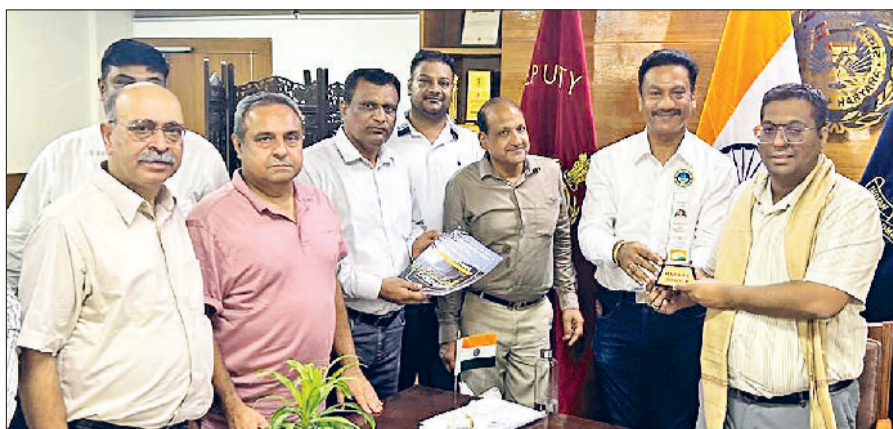
बहादुरगढ़। जिला उपायुक्त से मिलते कोबी से जुड़े उद्योगपति।