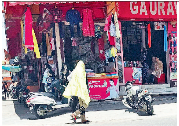
झज्जर। पुराना बस अड्डा मार्ग पर सिर कपड़े से ढककर जाता युवक।

तेज गर्मी की तपिश के चलते बाजार में आई ग्राहकों की कमी के कारण दुकानदार आजकल मंदे की मार झेलने को मजबूर हैं। यदि दोपहर के समय बाजार का दौरा किया जाए तो वहां सन्नाटा पसरा नजर आता है। दुकानदारों का कहना है कि पिछले तीन चार दिनों से प्रचंड गर्मी के कारण बाजार में ग्राहक ना के बराबर आ रहा है। जिस कारण सभी दुकानदारों के व्यापार पर इसका प्रभाव पड़ रहा है। यदि दुकानदारों की माने तो अब केवल सुबह व शाम के समय ही थोड़ी बहुत दुकानदारी हो पाती है जिससे बायुमिशकल दुकान व लेबर का खर्च निकलता है। चाहे खाद्य पदार्थों की दुकान हो, चाहे वस्त्रों या फिर सौंदर्य प्रसाधन की सभी दुकानदार लगभग