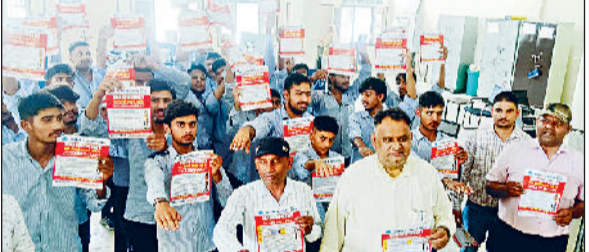
झज्जर। बाल श्रम बारे अन्य लोगों को जागरूक करने की शपथ लेते हुए विद्यार्थी एवं शिक्षक।