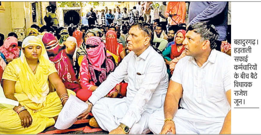
बहादुरगढ़। हड़ताली सफाई कर्मचारियों के बीच बैठे विधायक राजेश जून।

हड़ताल पर बैठे सफाई कर्मचारियों के बीच पहुंचे विधायक राजेश जून