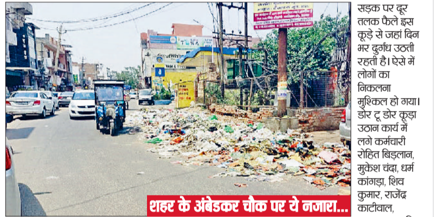
शहर के अंबेडकर चौक पर ये नगरा...

कर्मचारी बोले- दो माह से नहीं मिल रहा वेतन