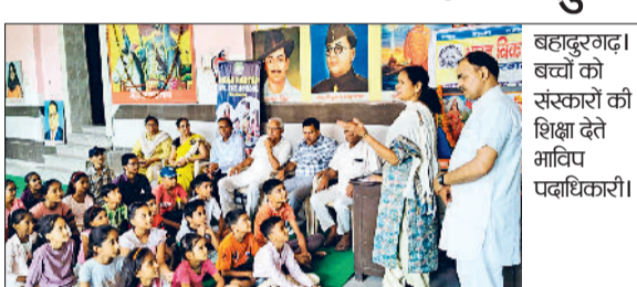
बहादुरगढ़। बच्चों को संस्कारों की शिक्षा देते मातृपेदाधिकारी।